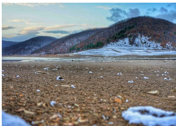
Foto 1. Liqeni i Badovcit gjatë thatësirave

skenarë për ndryshimet klimatike, parashikojnë ulje të disponueshmërisë së ujit me 20% deri në 2040-2050 11 .