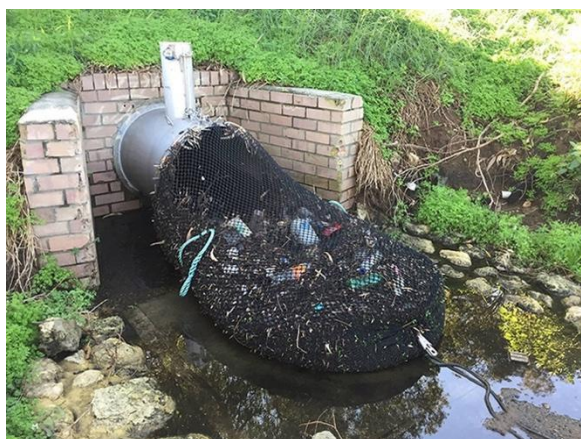
Foto 4. Rrjeti i dreanzhimit, Australi

Zgjidhje të tilla janë gjithashtu të mundshme dhe të këshillueshme në Kosovë, pasi përveçse janë me kosto efektive për të adresuar sfidën e mbeturinave të ngurta, ato kërkojnë vetëm alokimin e mjeteve nga kompanitë rajonale të ujit për pastrimin e tyre periodik. Figura dy më poshtë ofron një ilustrim të këtyre sistemeve të thjeshta për t'u ndërtuar dhe përdorur për parandalimin e mbeturinave detare.