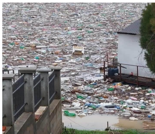
Foto 3. Liqeni i Ujmanit gjatë vërshimeve 2023 (kontribut qytetar)

Shumica e sistemeve të kullimit të ujërave nëntokësore në Kosovë shkarkohen në kolektorë të njëjtë me ata që vijnë nga ujërat e zeza, duke e bërë trajtimin e tyre të kombinuar më problematik, të shtrenjtë dhe më pak efikas. Kjo është identifikuar gjithashtu si një pengesë kryesore për maksimizimin e kapaciteteve të instaluar (dhe të planifikuara) të impianteve të trajtimit të ujërave të zeza, të cilat aktualisht janë duke u ndërtuar në mbarë Kosovën. Natyrë të ngjashme është edhe çështja e derdhjeve të ujërave të zeza në lumenj dhe përrenj pa u filtruar apo trajtuar më parë.