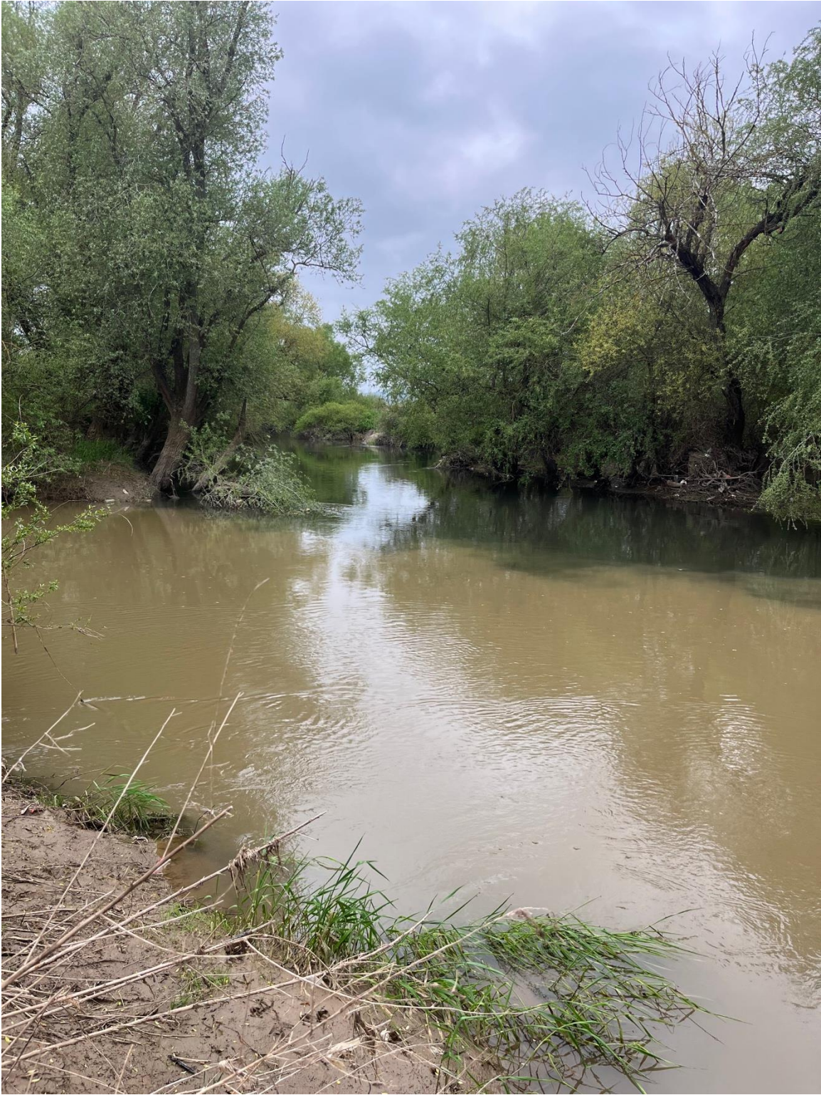
Figura 1. Bashkimi i lumenjëve Llapi dhe Sitnica në fshatin Lumadh