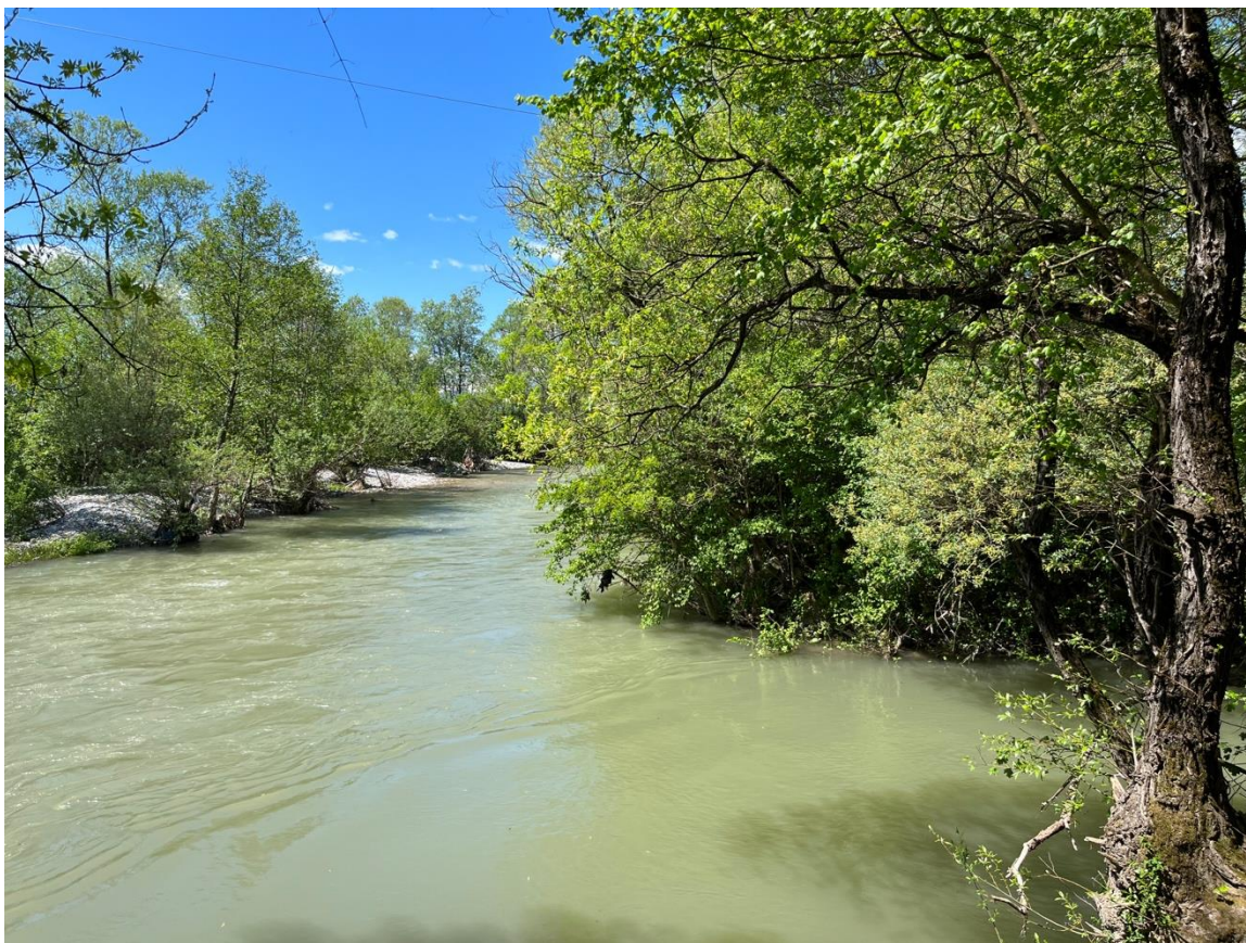
Figura 2. Lumi Drini i Bardhë